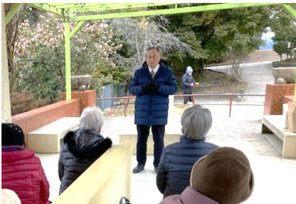
2023年2月16日(木) 船岡山公園にて